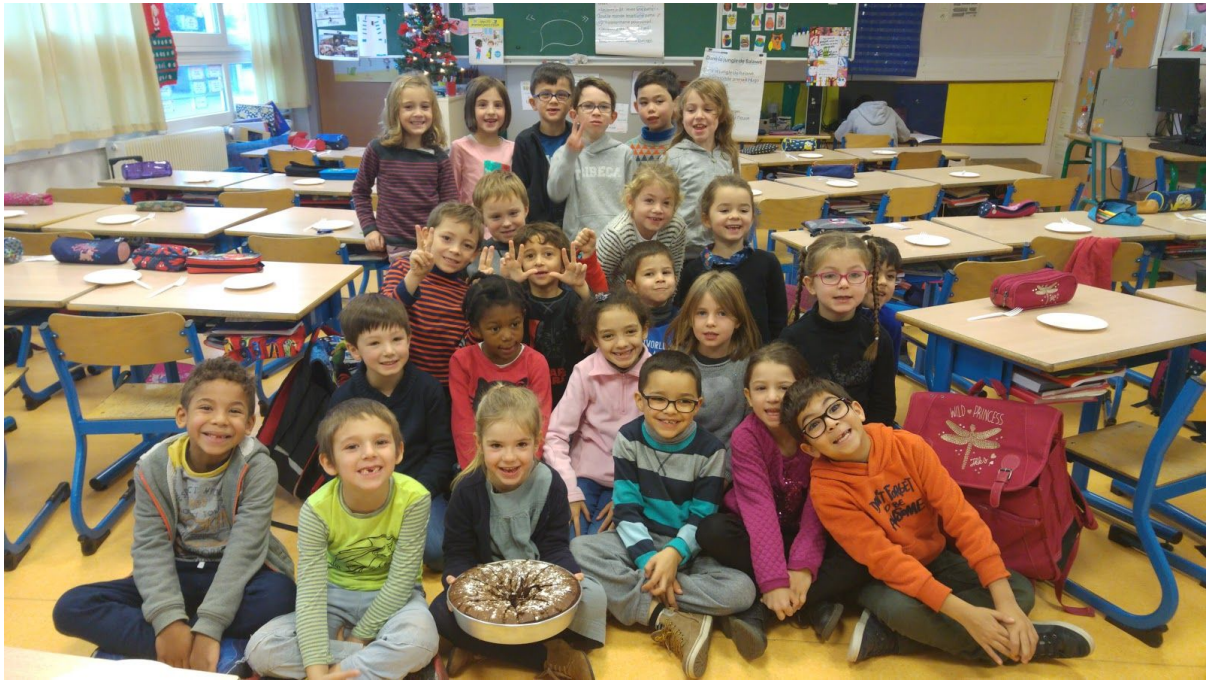
La photo souvenir de la classe des cp3... Sage comme cette belle image.... ??? Oui...