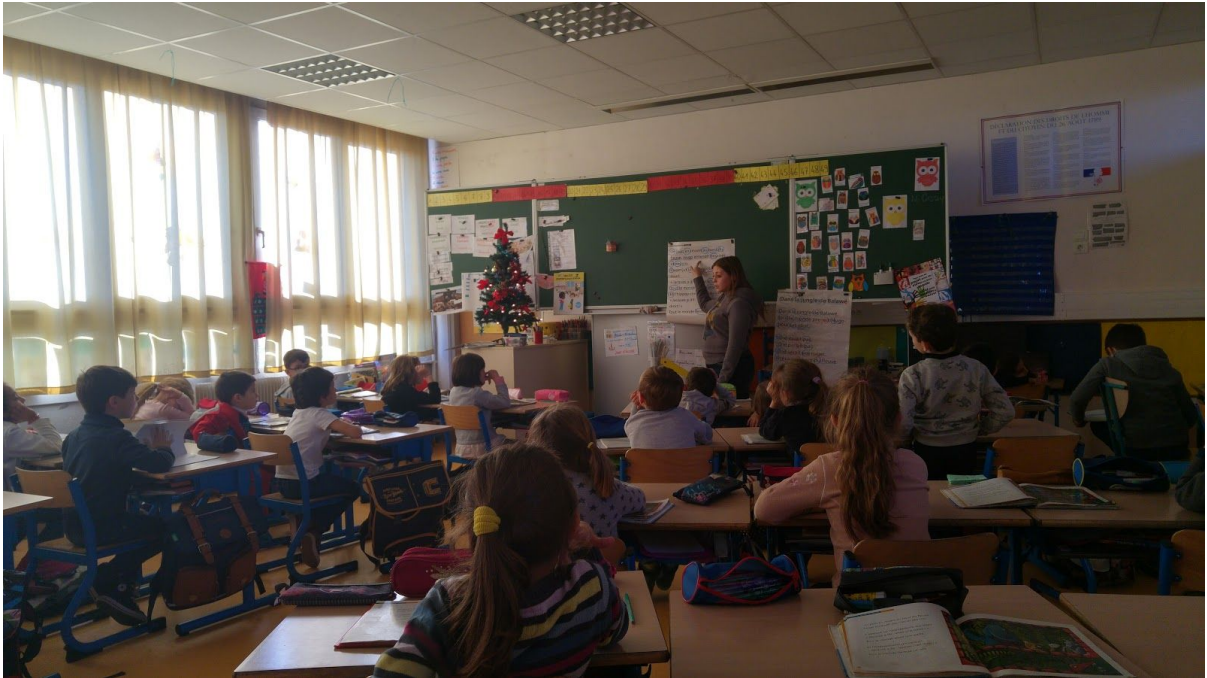
La séance de lecture